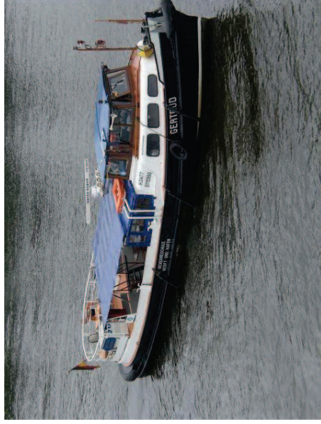
„GERTRUD“ nach dem Umbau