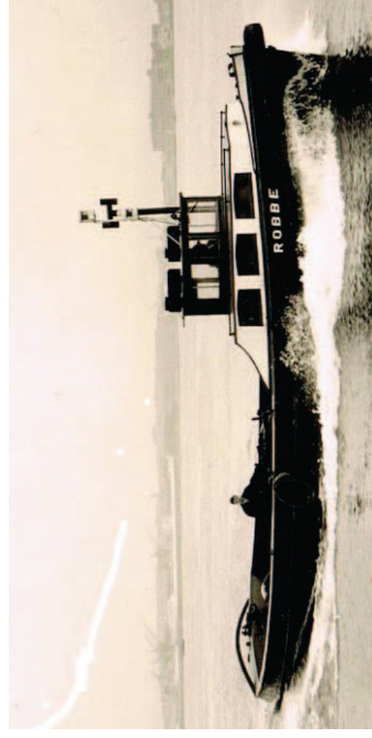
„GERTRUD“ ex. „ROBBE“ 1958